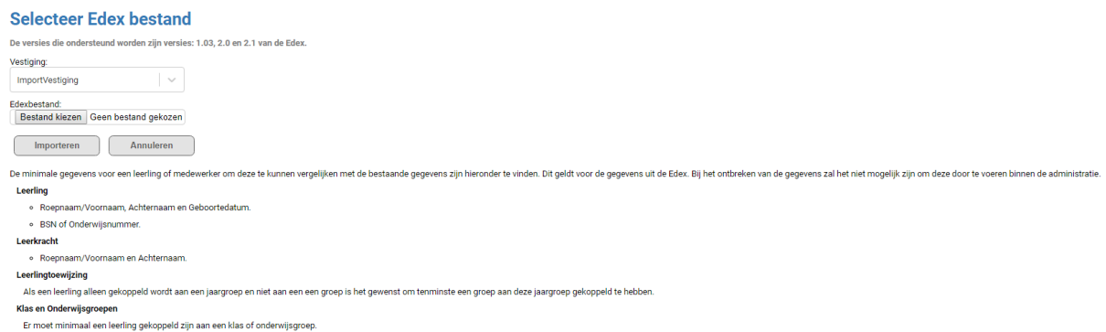
Figuur 2 Selecteer bestand scherm

Zodra u op “Edex importeren” heeft geklikt zal het scherm getoond worden waar een Edex bestand geselecteerd kan worden. Dit scherm is te zien in Figuur 2 Selecteer bestand scherm