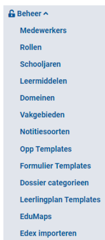
Figuur 1 Menu Edex importeren

De module “Edex importeren” is te vinden onder de kop “Beheer” in het menu aan de linkerkzijde van het scherm. Dit is visueel weergegeven in Figuur 1 Menu Edex importeren